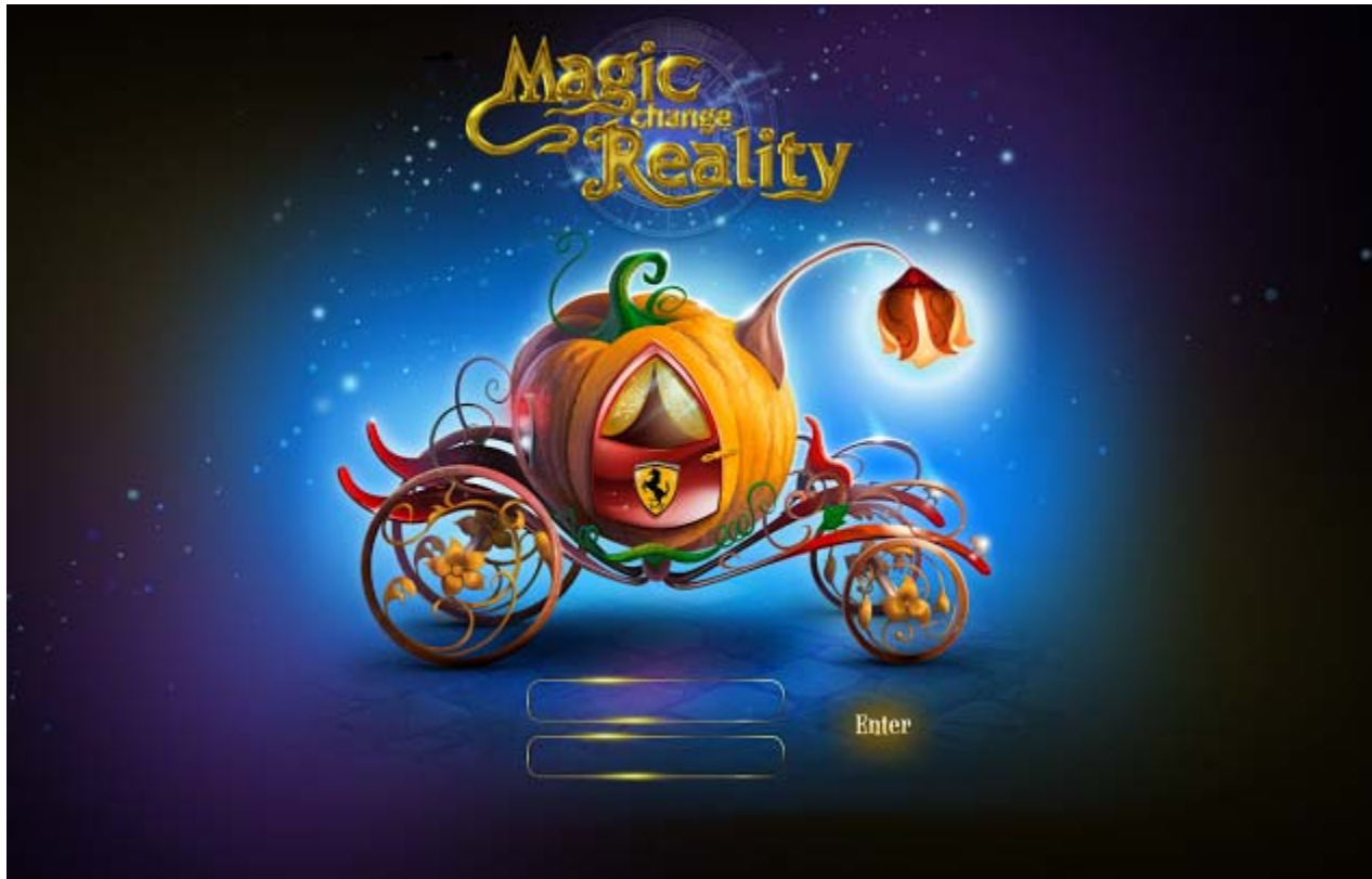
MagicTraffic - Login Screen End of 2013