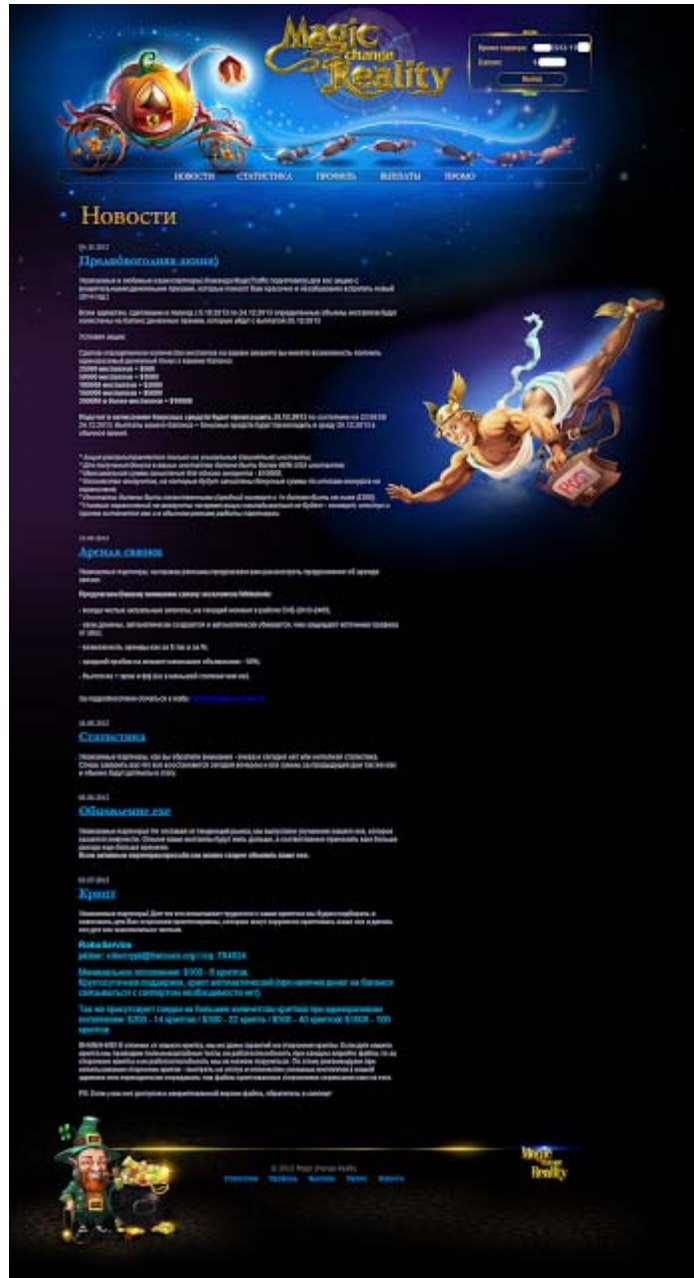
Magic Traffic 2013-11 News